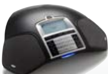
FÜR ALLE TELEFONKONFERENZEN Konftel 300

Anschluss: Analog, mobil (Handy)*, USB für VoIP. Anzahl Konferenzteilnehmer im Raum: Bis zu 10. Anzahl Teilnehmer bei Zusatzmikrofonen: Bis zu 16. Anzahl Teilnehmer mit Verstärkeranlage: Mehr als 16. Einzigartige Funktionen: Gesprächsaufzeichnung auf SD-Speicherkarte, Konferenzführer, Anschlusswahlschalter, Anschlussmöglichkeit für Headset, PA-Anschluss. Zertifiziert für: Avaya. Interoperabilität über die USB Verbindung zu: Microsoft Lync, Skype und ähnliche Kommunikationssysteme.