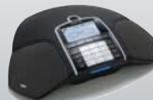
FÜR MOBILE NETZWERKE Konftel 300M

Anschluss: Analog. Anzahl Konferenzteilnehmer im Raum: Bis zu 10. Anzahl Teilnehmer bei Zusatzmikrofonen: Bis zu 16. Einzigartige Funktionen: Gesprächsaufzeichnung auf SD-Speicherkarte, Konferenzführer.