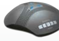
FLEXIBEL Konftel 60W

Anschluss: An digitale & IP-Systemtelefone, DECT*, mobil (Handy)*, PC für VoIP. Mit oder ohne Kabel. Anzahl Konferenzteilnehmer im Raum: Bis zu 6. Anzahl Teilnehmer bei Zusatzmikrofonen: Bis zu 10. Einzigartige Funktionen: Bluetooth™, flexible Nutzung. Zertifiziert für: Avaya, Alcatel-Lucent, Siemens.