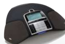
SIP Konftel 300IP

Anschluss: Analog, mobil (Handy)*, USB für VoIP. Anzahl Konferenzteilnehmer im Raum: Bis zu 10. Anzahl Teilnehmer bei Zusatzmikrofonen: Bis zu 16. Anzahl Teilnehmer mit Verstärkeranlage: Mehr als 16. Einzigartige Funktionen: Gesprächsaufzeichnung auf SD-Speicherkarte, Konferenzführer, Anschlusswahlschalter, Anschlussmöglichkeit für Headset, PA-Anschluss. Zertifiziert für: Avaya. Interoperabilität über die USB Verbindung zu: Microsoft Lync, Skype und ähnliche Kommunikationssysteme.