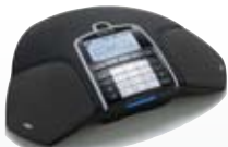
FÜR DECT-SYSTEME Konftel 300W

Anschluss: schnurlos DECT/GAP, mobil (Handy)*, USB für VoIP. Anzahl Konferenzteilnehmer im Raum: Bis zu 10. Einzigartige Funktionen: Akku mit 60 Stunden Sprechzeit, Gesprächsaufzeichnung auf SD-Speicherkarte, Konferenzführer, Anschlusswahlschalter. DECT Kompatibilität mit: Alcatel-Lucent, Aastra, Ascom, Avaya, Ericsson, Nortel, Panasonic, NEC-Philips, Siemens. Zertifiziert für: Avaya, Siemens. Interoperabilität über die USB Verbindung zu: Microsoft Lync, Skype und ähnliche Kommunikationssysteme.