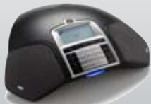
ANALOG Konftel 250

Anschluss: Analog. Anzahl Konferenzteilnehmer im Raum: Bis zu 10. Anzahl Teilnehmer bei Zusatzmikrofonen: Bis zu 16. Einzigartige Funktionen: Gesprächsaufzeichnung auf SD-Speicherkarte, Konferenzführer.